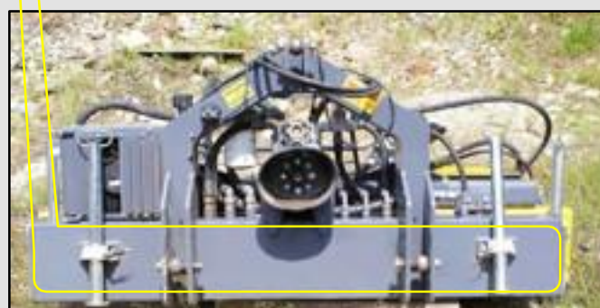
Встроенный масляный бак объемом 95 литров