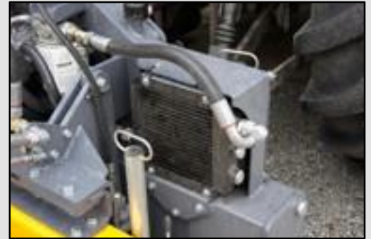
Собственный металлический масляный радиатор с вентилятором