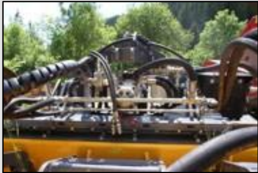
Три гидравлических насоса, приводимых в действие через вал универсального распределителя